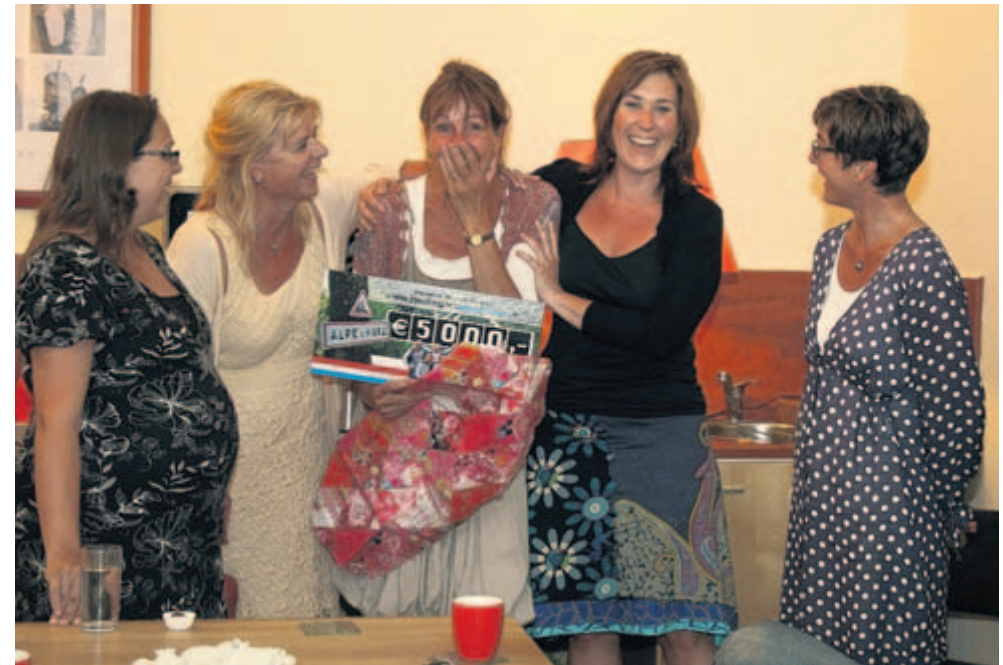
Blijde gezichten bij De Zonnesteen vanwege de ontvangen cheque.